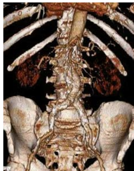
Obr. 3. 3D CT rekonstrukce obrazu aneuryzmatu břišní aorty po implantaci břišního stentgraftu.