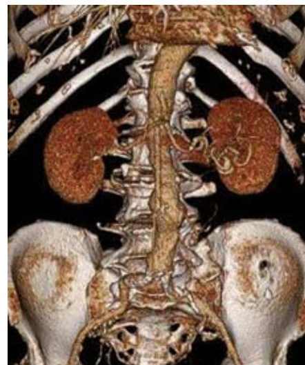
Obr. 1. 3D CT rekonstrukce obrazu aneuryzmatu břišní aorty s max. průměrem 49 mm.

Stěna aorty je tvořena nejenom buněčnými strukturami (např. buňky hladkých svalů), ale podstatnou část tvoří i matrixové proteiny (elastin a kolagen). Změny ve struktuře a poměrech uvedených proteinů pravděpodobně hrají velmi důležitou roli v patogenezi AAA. Víme, že obsah elastinu, který je především odpovědný za „pružnost“ aortální stěny, klesá od proximálních hrudních partií aorty k distálním infrarenálním úsekům. Největší pokles v obsahu elastinu je pozorován právě na přechodu aorty do infrarenálních partií, kde také dochází ke změně v poměrech mezi elastinem a kolagenem. Sám kolagen tvoří jakousi pevnou síť ve stěně aorty, která ochraňuje stěnu aorty před rupturou. Lze tedy velmi zjednodušeně shrnout, že změny v kvalitě či kvantitě elastinu ve stěně aorty spolupůsobí při formování vaku výdutě, změny v kvalitě či kvantitě kolagenu potom ovlivňují riziko ruptury vaku výdutě [19]. Na změnách ve struktuře aortální stěny u nemocných s AAA se pravděpodobně podílí zvýšená aktivita matrixových proteolytických enzymů, zejména metaloproteináz (MMP-9). V literatuře najdeme některé práce, jež prokazují až 3krát zvýšenou aktivitu MMP-9 ve stěně aorty u nemocných s AAA [20–23]. Histologické vyšetření stěny aorty u nemocných s AAA prokazují rovněž zánětlivou infiltraci zejména ve vrstvách medie a adventicie, u „klasického“ aterosklerotického postižení aortální stěny je tato zánětlivá infiltrace lokalizována v intimě [24]. Role zánětlivého procesu v patogenezi vývoje AAA zů-