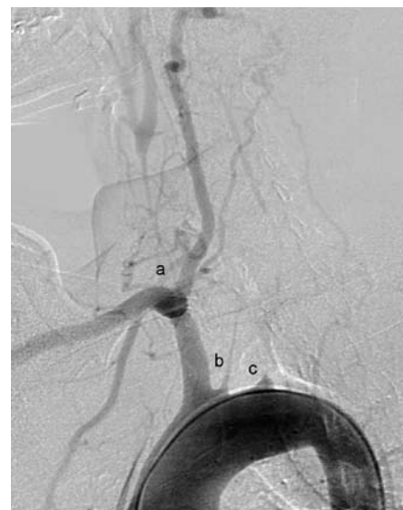
Obr. 3. Angiografický obrázek Takayasu arteritidy v chronickém stadiu s obliteracemi magistralních mozkových tepen. Mozek je zásobován jedinou mohutnou vertebrální tepnou. a – obliterace pravé společné karotidy, b – obliterace levé společné karotidy, c – obliterace levostranné podklíčkové tepny.

Léčba chronické periaortitidy a retroperitoneální fibrózy závisí na stupni renální insuficience. V případech pokročilého renálního selhání je indikováno včasné odstranění obstrukce močovýchodů a to buď retrogradní katetrizací ureterů, nebo perkutánní nefrostomií. Následuje operační řešení spočívající v uvolnění močovýchodů z okolního vaziva. Postoperačně je doporučována léčba kortikoidy k zabránění progresu onemocnění. V případě absence významnější renální insuficience doporučuje řada autorů primárně postupovat konzervativně a nemocné léčit kortikoidy. Ty vedou k ústupu systémových příznaků i ústupu uretrální obstrukce [23].