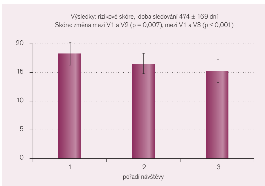
Obr. 2. Vývoj rizikového skóre mezi kontrolami.