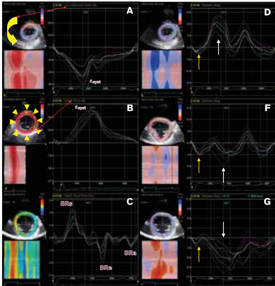
Obr. 3. Příklad posterolaterálního aneuryzmatu LK s transmurní jizvou a trombem.

Transtorakální echokardiografie (A, B, C, D): V parasternální projekci na krátkou osu LK je při použití speckle tracking echokardiografie patrná dyskineze v posterobazálním (fialová barva) a inferolaterálním segmentu LK (zelená barva).