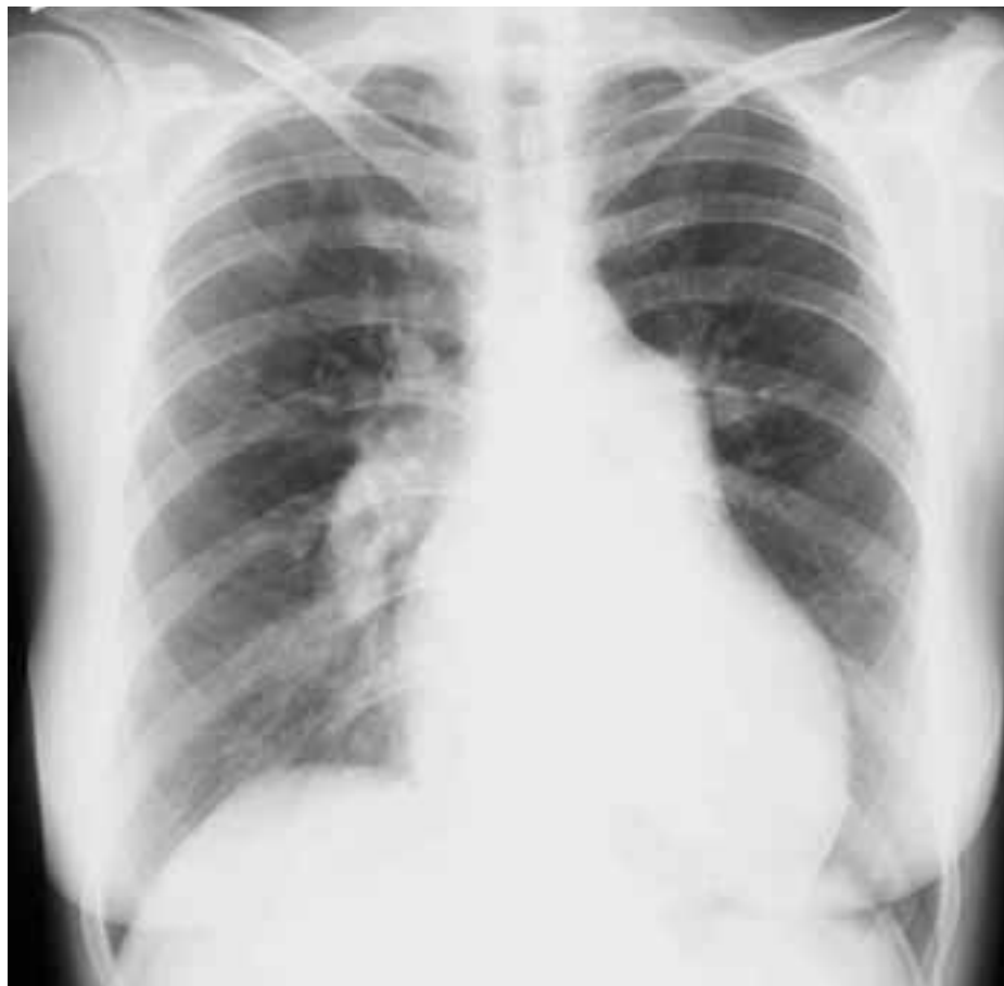
Obr. 3. Skiagram hrudníku u nemocné s pokročilou plicní arteriální hypertenzí. Aortální knoflík je nevýrazný. Levá kontura srdeční je tvořena zvětšenou pravou komorou. Šířka pulmonálního segmentu: 55 mm, šířka sestupné větve pravé plicnice: 23 mm.

Cílem oxygenoterapie je dosáhnout saturace tepenné krve kyslíkem nad 90 %. Indikace