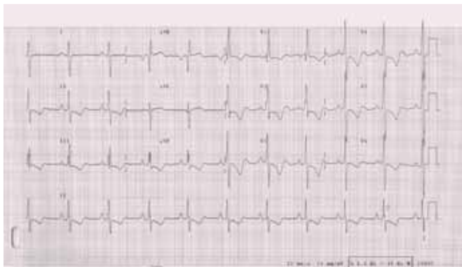
Obr. 2. EKG u nemocné s těžkou plicní arteriální hypertenzí: P pulmonale. R/S ve V1 > 1, inkompletní blokáda pravého raménka Tawarova, naznačené deprese ST a negativní T ve svodech II, III, aVF, V1-6.