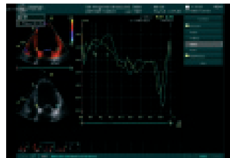
Obr. 2. Asynchronní rychlostní křivky z bazálních částí septa a laterální stěny levé komory získané v apikální 4dutinové projekci barevnou tkáňovou dopplerovskou echokardiografií (časový rozdíl mezi vrcholy rychlostních křivek v systole činí 130 ms).

Notabartolo et al podrobněji analyzovali časové rozdíly mezi vrcholy systolické kontrakce 6 bazálních segmentů stěn LK (peak velocity difference – PVD) a našli reverzní remodelaci LK po BS u většiny nemocných s PVD > 110 ms [27]. Bax et al omezili srovnávání vrcholů kontrakce jen na bazální část septa a laterální stěny (která nejčastěji představuje oblast nejpоздněnější mechanické aktivace LK) [15]. Z mnoha klinických parametrů (včetně šíře QRS), pouze PVD dokázal odlišit respondery na BS od non-responderů, přičemž optimální dělicí hodnoty byla \geq 60 ms. Stejní autoři v rozšířeném souboru zahrnujícím 85 nemocných se srdeční slabostí tuto hodnotu korigovali na PVD 65 ms, což umožnilo předpovědět klinické zlepšení se senzitivitou a specificitou 80 % či předpovědět reverzní remodelaci LK se senzitivitou a specificitou 92 % [14]. Nemocní s dysynchronií \geq 65 ms měli i významně lepší prognózu než ti s hodnotou PVD nižší. Obr. 2 ukazuje asynchronní rychlostní křivky z bazální oblasti septa a laterální stěny odvozené z barevné tkáňové dopplerovské echokardiografie. Rozdíl mezi rychlostními vrcholy pohybu septa a laterální stěny činil 130 ms – jednalo se tedy o významnou asynchronii. K velmi podobné „cutoff“ hodnotě 60 ms dospěli