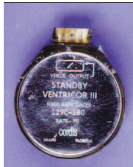
Obr. 4. První „standby“ kardiostimulátor firmy Cordis Corp. pracující v režimu VVT. Název Ventrivor III-129C byl brzy změněn na Ectocor. Přístroj byl vybaven 5 zinko-rtuťovými články a byl vyráběn v letech 1965–1967.