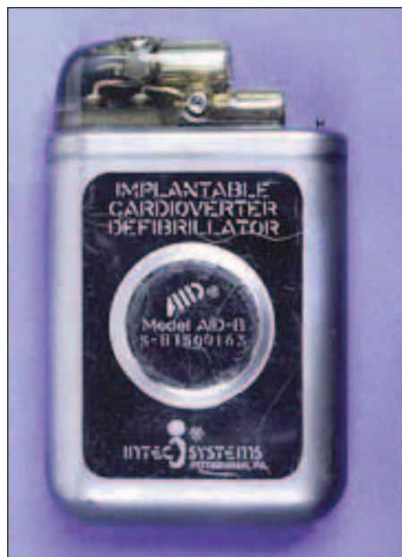
Obr. 7. Jeden z prvních ICD. Tento model AID-B firmy INTEC System pochází z roku 1982. Jednalo se o neprogramovatelný přístroj schopný pouze vysokoenergetického výdeje.

vyvinuté N. Smythem [61,62]. Následně se objevují nové modely elektrody, nejdříve elektrody s členitým povrchem („fractal“) a se zpětnými háčky („tined“) [63] a následně i elektrody s aktivní fixací šroubováním („screw-in“) [64]. Silikonem potažené elektrody jsou nahrazeny polyuretanovými, které jsou pevnější, odolnější vůči mechanické únavě, v průměru menší a na povrchu kluzčí, což umožňovalo snazší zavedení dvou elektrod do jedné žíly [65]. Od roku 1979 je vyvinut systém pro punkční zavedení elektrody (Peel-Away) do podklíčkové žíly [66] jako upravená forma již známého Seldingerova katetrizačního přístupu. Významnou bariérou ve všeobecném přijetí 2dutinové kardiostimulace implantujícími lékaři byly ale malé znalosti charakteristiky a klinického chování 2dutinového systému in vivo [67]. Extrémní flexibilita nové generace kardiostimulátorů je právě závislá na vnějším programování. Neadekvátní programování a komplexita systému s sebou nese potenciální nebezpečí ve formě oversensingu, undersensingu, neadekvátní vlastní inhibice, indukce pacemakerové tachykardie [68] aj. Na lékaře jsou kladeny velké požadavky v porozumění principů a časování [69]. Přes všechny nedokonalosti je jeden z konsenzů NASPE v roce 1984 výrok, že 2dutinová stimulace je indikována v 60–80 % všech případů [70].