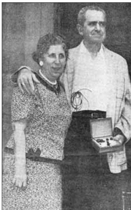
Obr. 2. Pacient s dlouhodobou externí kardiostimulací přes intravenózně zavedenou elektrodu. Pacient přežil s tímto typem stimulace od května 1959 do listopadu 1962.

vývoje společnosti Elema-Schönander, která se později stala součástí firmy Siemens-Elma. Tato firma se specializovala na vývoj a výrobu kardiostimulátorů. V roce 1994 byla prodána americké společnosti Pacesetter, která byla později prodána firmě St. Jude Medical.