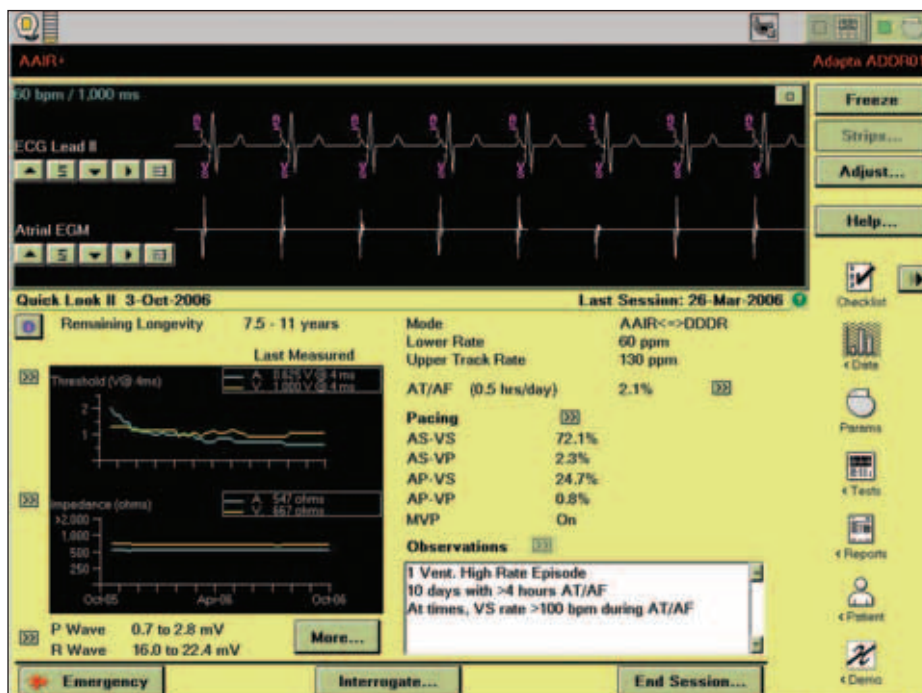
Obr. 1. Obrazovka Quick Look II.

Studie byla prováděna jako retrospektivní. Do studie byli zařazeni všichni nemocní, kterým byla na našem pracovišti provedena implantace přístroje Adapta ADDR01 (Medtronic, Minneapolis, MI, USA) v období od 1. 6. 2005