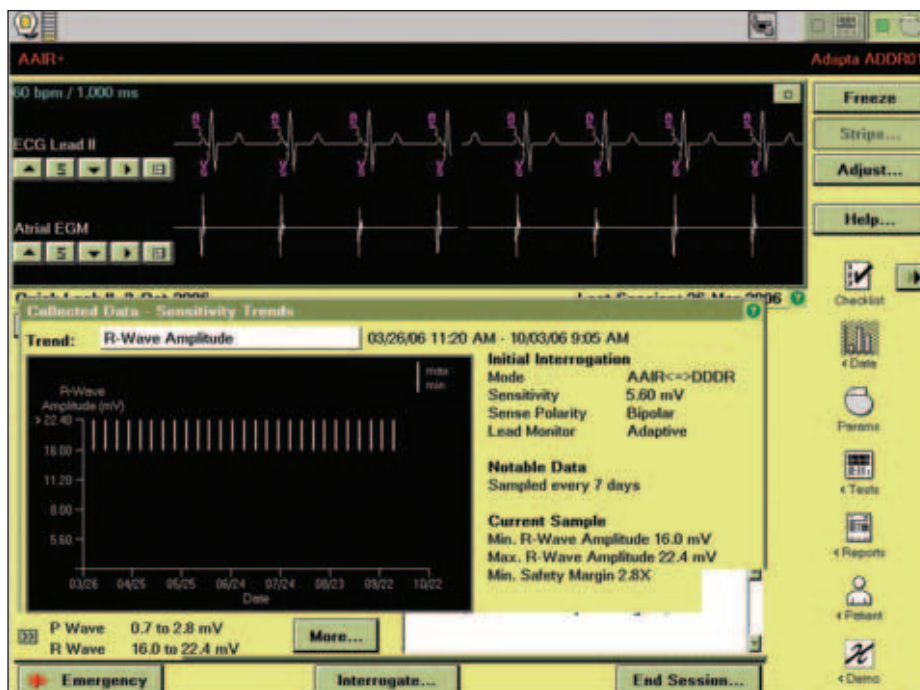
Obr. 5. Průběh měření komorového sensingu.

Amplituda intrakardiální vlny P byla změřena a byla shledána vyhovující v 9 případech. Ve 3 případech byla změřena, ale naměřené hodnoty si vyžádaly další analýzu – prvnímu číselnému údaji předcházelo znaménko „<“ a v 15 případech byl podíl stimulovaných cyklů ro-