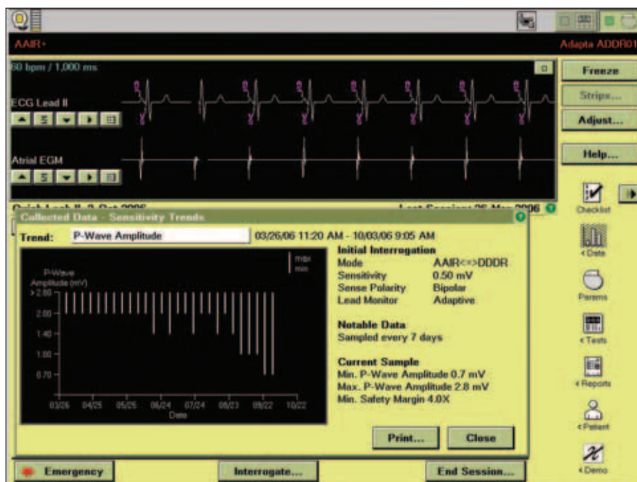
Obr. 4. Průběh měření síňového sensingu.

i hodnotu stimulačního prahu komorové elektrody. Měřicí algoritmus spočívá ve vyhodnocení přítomnosti tzv. stimulací evokované odpovědi při snižování stimulační energie. Předem nastaveno je měření v intervalu 24 hodin, a to 1 hodinu po půlnoci. Ošetřující lékař může zvolit jinou dobu měření, v případě potřeby může měřicí interval prodloužit prodloužit až na max. 7 dnů či zkrátit na minimum 1 hodiny. Je možné zvolit i jinou dobu měření. Hodnota stimulační energie je přednastavena na adaptivní s rezervou dvojnásobku napětí stimulu oproti napětí stimulu prahového.