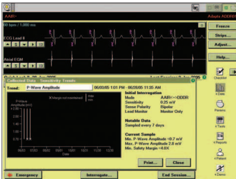
Obr. 6. Průběh měření síňového sensingu v situaci, kdy opakovaně není dodržen bezpečnostní limit algoritmu „sensing assurance“.

ven nebo vyšší než 80 %, a v takovém případě přístroj na této obrazovce hodnotu amplitudy neuvádí. V případě amplitudy komorového signálu byl tento údaj změřen v 18 případech a sledán vyhovujícím. V 2 dalších případech byl změřen, avšak vyžadoval další kontrolu – prvnímu číselnému údaji přecházelo znaménko „<“ a v 7 případech byl podíl stimulovaných cyklů alespoň 80 %. Ve všech případech byl ponechán režim „sensing assurance“.