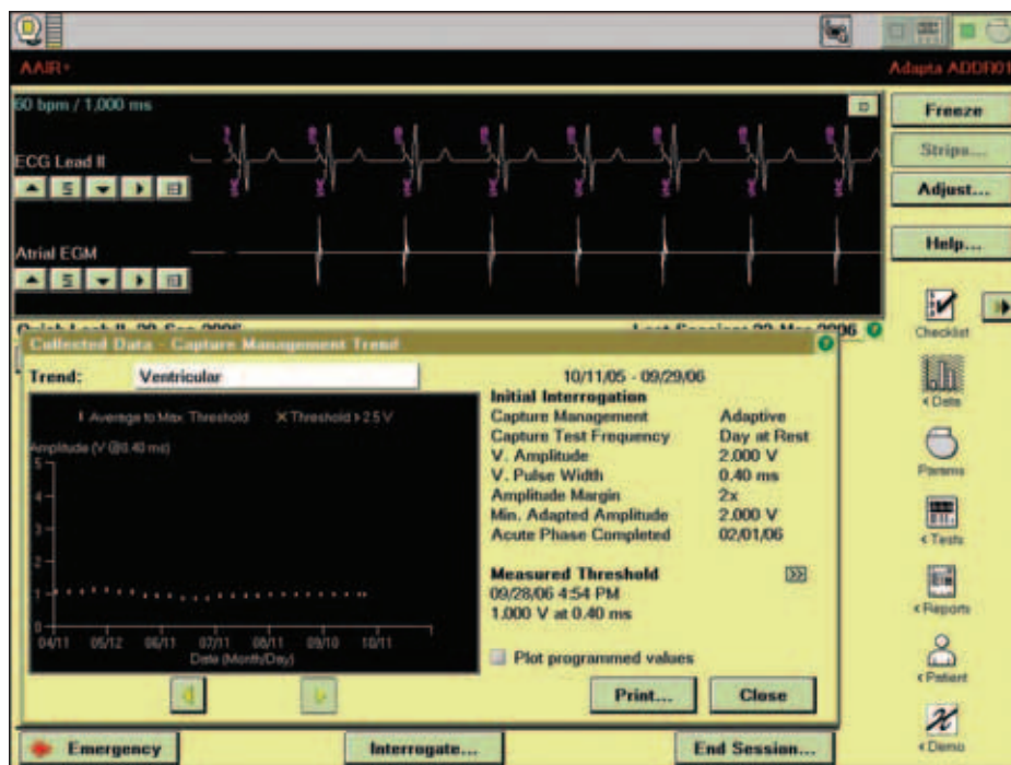
Obr. 3. Podrobnosti o průběhu automatického měření komorového prahu.