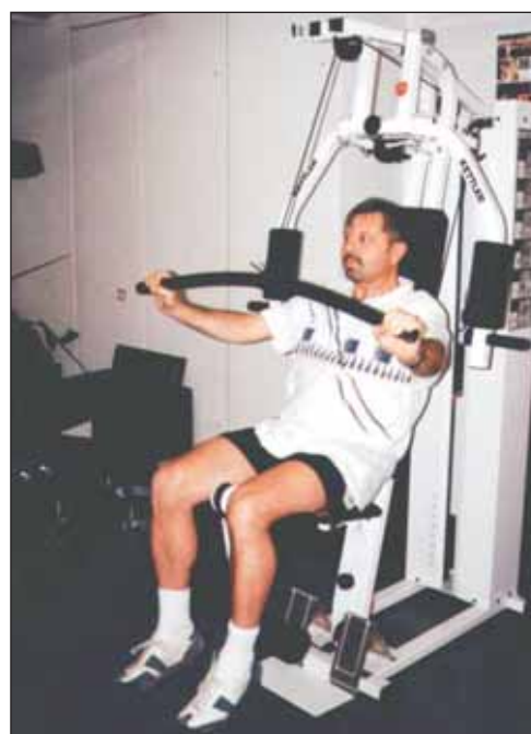
Obr. 4. Stahování zátěže.