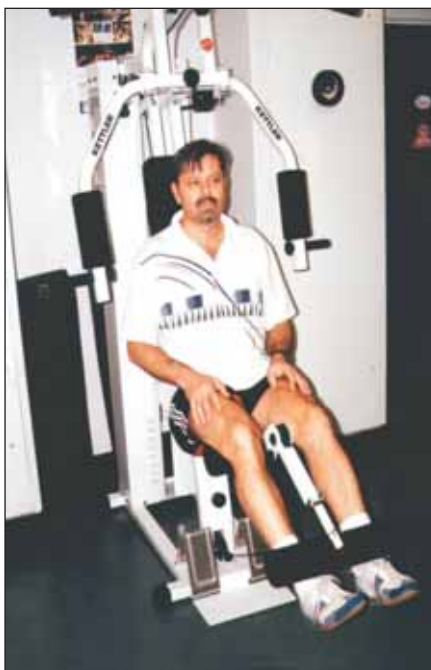
Obr. 3. Posilování nohou sounož.