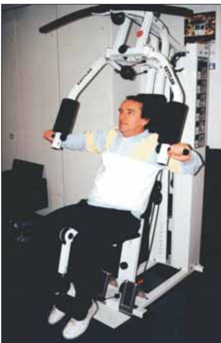
Obr. 2. Vzpírání zátěže dopředu.

Pravidelný vytrvalostní a silový trénink přináší charakteristické změny, které vedou ke zlepšení funkční kapacity a síly. Tyto změny nazýváme tréninkovým efektem a dovolují dosáhnout vyššího fyzického zatížení s nižší frekvenční odpovědí. Fyzický trénink střední in-