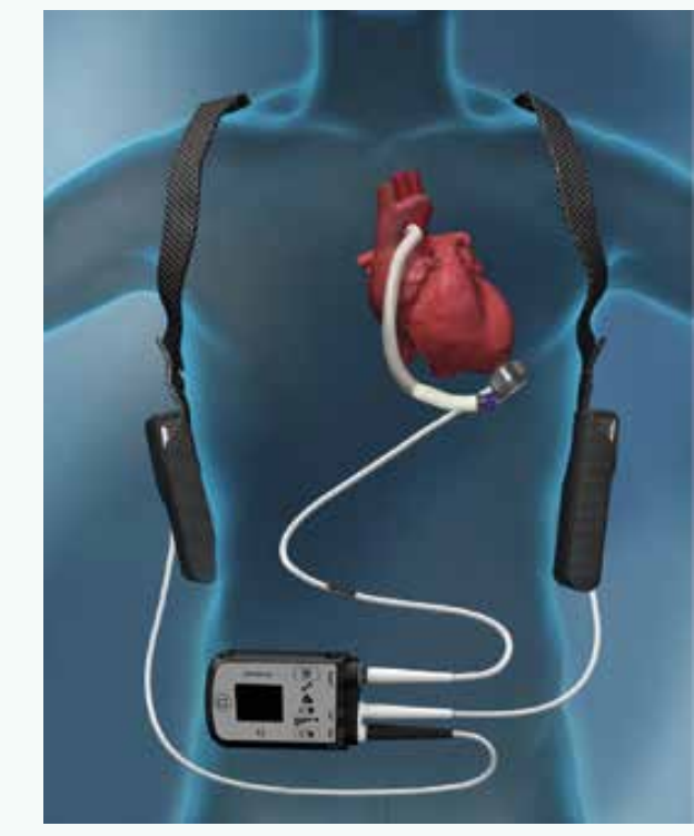
Schéma | Vliv implantace mechanické srdeční podpory (Heart Mate II nebo 3) a cévních parametrů (pulztilního indexu v karotických tepnách a augmentačního indexu) na klinické příhody (median sledování 27 měsíců)