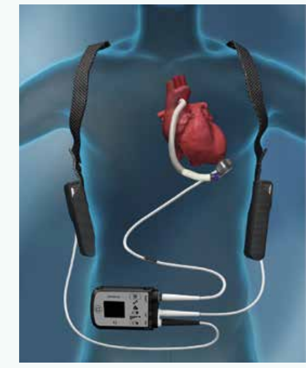
Obr | Mechanická srdeční podpora HeartMate 3 (použito se svolením společnosti Abbott U.S.)