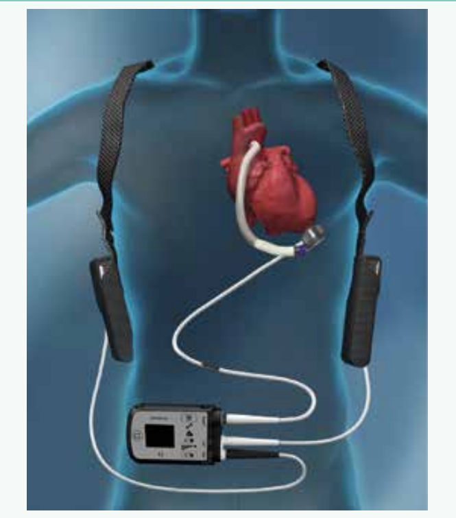
Obr | Mechanická srdeční podpora HeartMate 3