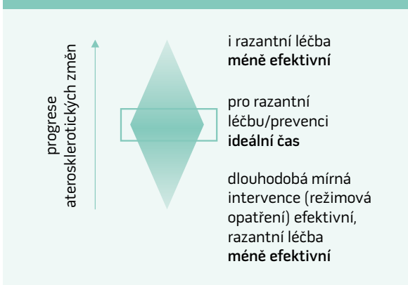
Schéma 2. Léčebné možnosti dle různých stadií aterosklerotického procesu