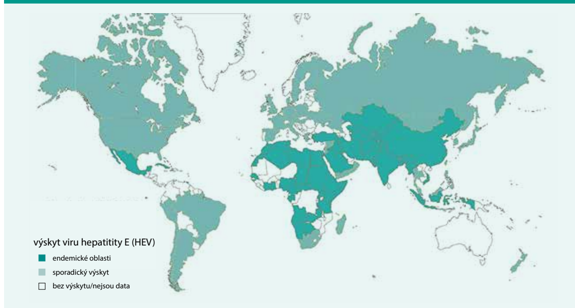
Obr. Rozložení endemických oblastí a oblastí sporadického výskytu HEV ve světě

Těžší průběh nemoci je popisován u pacientů s preexistujícím onemocněním jater u všech genotypů HEV. Počáteční fáze infekce probíhá jako akutní hepatitida E u jinak zdravých pacientů, následně ale může dojít k dekompenzaci chronického onemocnění jater až jejich selhání a úmrtí.