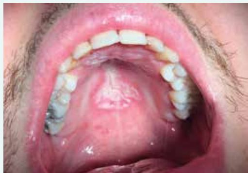
Obr. 1. Akutní pseudomembranózní kandidóza na patrové sliznici u nedostatečně kompenzovaného mladého diabetika 1. typu (22 let).