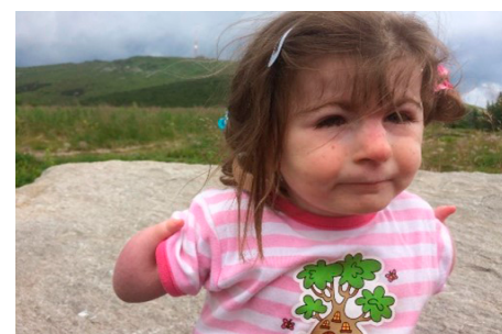
Obrázok 2, 3: V čase klinicko-logopedickej intervencie mala pacientka 6,5 roka