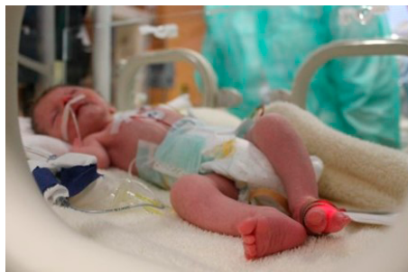
Obrázok 1: Dieťa po narodení

Dieťa sa narodilo z fyziologickej gravidity v 36. gestačnom týždni, pôrodná hmotnosť bola 1 660 gramov, placenta bola fibrotická s infarktami, pôrod bol indikovaný. Popôrodné Apgar skóre bolo 9 z 10. Ihneď po pôrode bola zjavná faciálna a somatická polystigmatizácia s mikrognáciou, rážštepom uvuly, ektroméliou (znetvorenie jednej alebo viacerých končatín, prípadne ich nevyvinutie), nezrelým genitálom a prenatálnou hypotrofiou. Karyotyp bol v norme. Po narodení bol suponovaný u pacientky syndróm Cornelia de Lange. Tento vzácny syndróm bol následne verifikovaný genetickým vyšetrením. Okrem vyššie uvedených znakov ochorenia u pacientky bola verifikovaná bilaterálna percepčná porucha sluchu stredne ťažkého stupňa kompenzovaná naslúchacím aparátom, mikrokránium a inkontinencia.