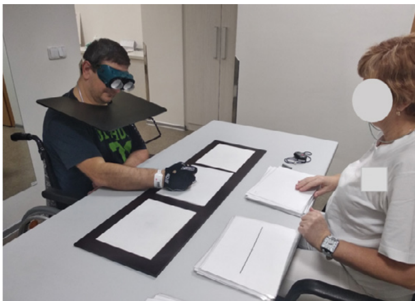
Obrázek 1: Terapie pomocí prizmatických brýlí

LPA využívá efektu laterálního posouvání zrakového pole pomocí prizmatických čoček, což způsobuje optickou odchylku, při které jsou z pohledu subjektu viděné objekty laterálně odchýlené od jejich aktuální pozice.