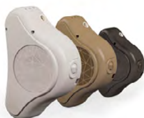
Obrázek 4: Audio procesor systému ADHEAR, který se připevňuje na adaptér