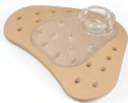
Obrázek 3: Adhezivní adaptér, který se lepí na kůži za ucho