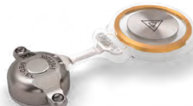
Obrázek 5: Bonebridge – aktivní transkutánní implantát pro kostní vedení, vnitřní část