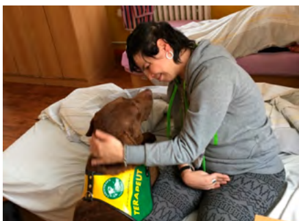
Klientka s afázií a dysartrií po těžkém kraniotraumatu 1

Průměrně provádíme terapii u osmi pacientů denně, někdy doprovázíme klienta například k soudu jako komunikátoři či napomáháme klientům v komunikaci s Centry duševního zdraví. Logopedická terapie ve zdravotnickém prostředí je vždy indikována lékaři, po vyšetření společně vyhodnocujeme, zda je logopedická terapie vhodná či vůbec možná, a snažíme se objasnit cíle terapie a klienta motivovat k zahájení terapie.