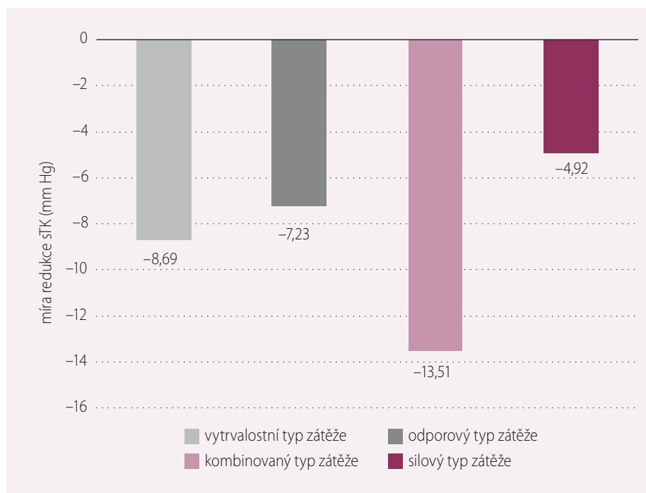
Graf 2. Vliv jednotlivých typů zátěže na pokles hodnot TK (mm Hg). sTK – systolický krevní tlak