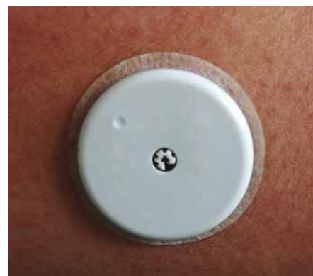
Obr. 1. Senzor Freestyle Libre.

Jednoduchost použití a nižší náklady proti CGM svádí k použití FGM i u dlouhotrvajícího DM 2. typu (DM2) s vyčerpanou sekrecí inzulínu, jehož principy léčby se v mnohém podobají DM1. Studie REPLACE [12] zařadila 224 pacientů randomizovaných 2 : 1 k léčbě FGM vs. klasický selfmonitoring, šlo o pacienty léčené intenzifikovaným inzulínovým režimem nebo inzulínovou pumpou, kompenzace byla průměrná (glykovaný Hb 73 \pm 11 mmol/mol). Pacienti neabsolvovali zvláštní edukaci na FGM.