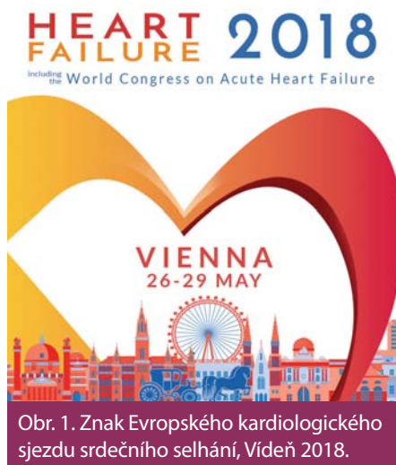
Obr. 1. Znak Evropského kardiologického sjezdu srdečního selhání, Vídeň 2018.

Sakubitril valsartan je znám především ze studie PARADIGM-HF, která prokázala jasný efekt na snížení mortality i morbidity u nemocných s CHSS. Prezentována byla na ESC