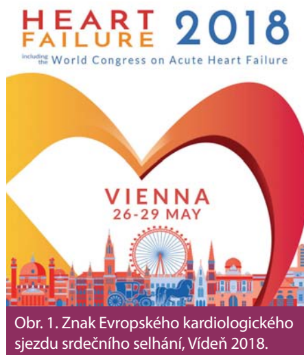
Obr. 1. Znak Evropského kardiologického sjezdu srdečního selhání, Vídeň 2018.

Sakubitril valsartan je znám především ze studie PARADIGM-HF, která prokázala jasný efekt na snížení mortality i morbidity u nemocných s CHSS. Prezentována byla na ESC