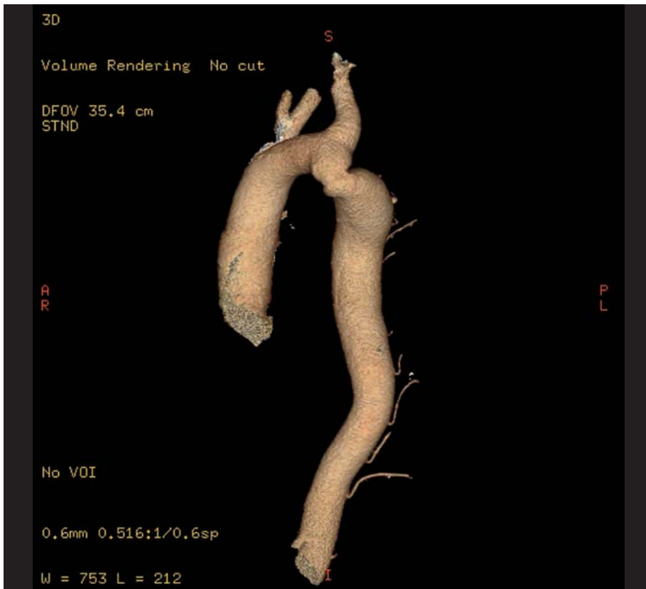
Obr. 1. Koarktace aorty diagnostikovaná u 58letého muže s rezistentní hypertenzí (zjištěnou od 18 let a léčenou od 28 let). Převzato z [10].