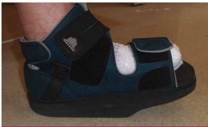
Obr. 4. Sériová odlehčovací pomůcka k odlehčení přednoží – pooperační polobotka. Používá se vždy s berlemi.