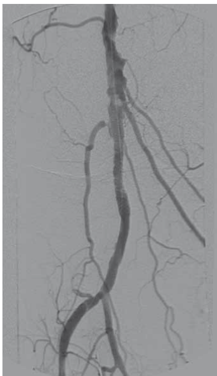
Obr. 2. Úsek P2–3 po úspěšné revaskularizaci a následné implantaci stentu.

všichni diabetologové, chirurgové a praktici. Pacienti, kteří jsou dispenzarizováni v naší podiatrické ambulanci, jsou převážně zachyceni až po revaskularizaci na tepnách dolních končetin. V ideálním případě by to mělo být právě naopak. Pacient s primozáchytem defektu je v naší podiatrické ambulanci komplexně vyšetřen vč. lokálního vyšetření defektu. Další vyšetření vyplývají z lokálního a objektivního nálezu. Při podezření na CLI je vždy ještě v den vyšetření nebo den následující doplněno triplexní ultrazvukové vyšetření tepen dolních končetin (DK). Rozhodne se o doplnění krevních odběrů k posouzení zánětlivé aktivity, nutričních parametrů, event. posouzení anémie. Je doplněno měření rozdílu teplot k posouzení závažnosti zánětlivého procesu na periférii dolních končetin. Lokální rozdíl od dvou stupňů se hodnotí jako významný. Dále standardně provádíme RTG vyšetření nohou k posouzení osteolytických změn na skeletu. Magnetickou rezonanci (MR) či scintigrafii skeletu indikujeme při podezření na Charcottovu osteoartropatii nebo při vysoce suspektním podezření na osteomyelitidu s negativním RTG vyšetřením a negativním probe to bone testem. Je do-