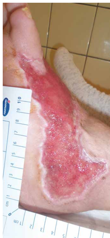
Obr. 6. Zlepšení po komplexním zaléčení a zvládnutí infekce (postupně provedena perkutánní angioplastika (PTA) s implantací stentu do ilického řečiště vlevo, distální bypass, PTA ilického řečiště vlevo pro restenózu, terapie anemického syndromu, nutriční podpora pro hypalbuminemii, dlouhodobá cílená antibiotická terapie pro recidivy flegmony, 2x série hyperbaroxické terapie, několikanásobná aplikace autologní plazmy). Vidíme zmenšení plochy vyčištění a červenou granulační tkáň. Doba léčení devět měsíců.

Amputaci indikujeme po konzultaci s lékaři chirurgického oddělení v případě nerevaskularizovatelného nálezu s progresí ischemie nebo flegmony nereagující na antibiotickou terapii. Další indikace k operačnímu zákroku je odstranění infikované nekrotické tkáně. Preferuje se nízká amputace nebo amputace v minimálně nutném rozsahu z hlediska postižené tkáně a technických možností zákroku. Transkutánní kyslík pod 30 mm Hg nebo hodnota kotníkového tlaku pod 50 mm Hg zhoršuje prognózu po amputaci [3]. Je maximální snaha, aby po amputaci byla zachována schopnost použití nohy pro chůzi. Je zde ale nutno počítat s rozvojem deformity končetiny, kterou pak musíme maximálně kompenzovat individuální obuví. Pokud je to možné, odesíláme vzorek z amputační linie ke kultivaci na mikrobiologii a k histologickému vyšetření k posou-