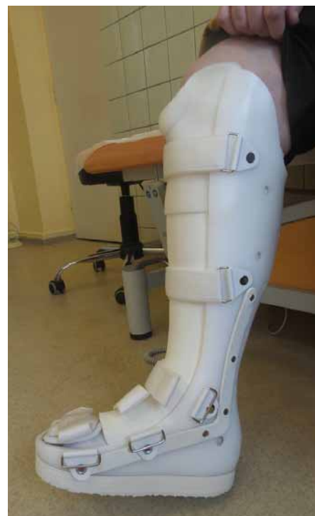
Obr. 3. Individuální ortéza – vyrobená na základě měrných podkladů jednotlivého pacienta.

U pacientů s CLI či SDN se spoluúčastí ischemie je v našich podmínkách revaskularizace prováděna co nejdříve, pokud je nutné, tak i do 24 hod. Naléhavost výkonu je určena dle lokálního nálezu a vývoje defektu i celkového stavu pacienta individuálně. Je třeba si uvědomit, že kvalitní triplexní ultrazvukové vyšetření je u dobře vyšetřitelného pacienta absolutně dostačující k provedení endovaskulárního výkonu distálně od společné femorální tepny či při lokálním postižení ilického řečiště. Častými případy jsou pacienti s SDN