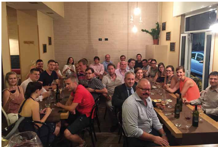
Obr. 1. Společná večeře mladých kardiologů s předsedou ČKS na kongresu ESC.

Po týdenní periodě, během které si nemocní zvykali na CPAP, bylo randomizováno