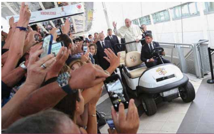
Obr. 2. Kardiologové vítají papeže Františka.