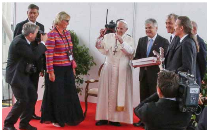
Obr. 3. Papež František s dárkem – fonendoskopem.

studii srovnávající edoxaban v dávce 60 mg oproti enoxaparinu s warfarinem u pacientů podstupujících elektrickou kardioverzi. Interní kardiologická klinika FN Brno pod vedením doc. Lábrové patřila k největším centrům na světě co do počtu zařazených pacientů. Dávka edoxabanu byla snižována při renální insuficienci. Primární účinnostní cíl byla CMP, embolizační příhoda, IM nebo KV úmrtí. Primární bezpečnostní cíl byla velká krvácení. Celkem bylo zařazeno 2 199 nemocných (edoxaban = 1 095, enoxaparin + warfarin = 1 104) průměrného věku 64 let. Primární účinnostní cíl byl 5 (< 1 %) nemocných v edoxabanové větvi a u 11 (1 %) nemocných ve větvi enoxaparin + warfarin (graf 1). Primární bezpečnostní cíl byl u 16 (1 %) nemocných v edoxabanové větvi a u 11 (1 %) v enoxaparin + warfarinové větvi.