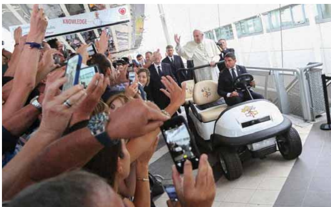
Obr. 2. Kardiologové vítají papeže Františka.