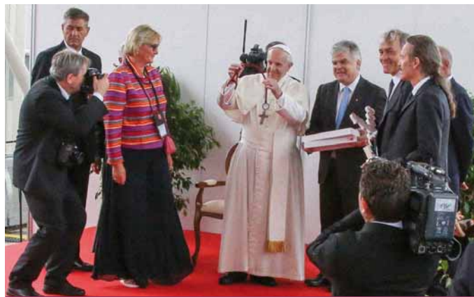
Obr. 3. Papež František s dárkem – fonendoskopem.

studii srovnávající edoxaban v dávce 60 mg oproti enoxaparinu s warfarinem u pacientů podstupujících elektrickou kardioverzi. Interní kardiologická klinika FN Brno pod vedením doc. Lábrové patřila k největším centrům na světě co do počtu zařazených pacientů. Dávka edoxabanu byla snižována při renální insuficienci. Primární účinnostní cíl byla CMP, embolizační příhoda, IM nebo KV úmrtí. Primární bezpečnostní cíl byla velká krvácení. Celkem bylo zařazeno 2 199 nemocných (edoxaban = 1 095, enoxaparin + warfarin = 1 104) průměrného věku 64 let. Primární účinnostní cíl byl 5 (< 1 %) nemocných v edoxabanové větvi a u 11 (1 %) nemocných ve větvi enoxaparin + warfarin (graf 1). Primární bezpečnostní cíl byl u 16 (1 %) nemocných v edoxabanové větvi a u 11 (1 %) v enoxaparin + warfarinové větvi.