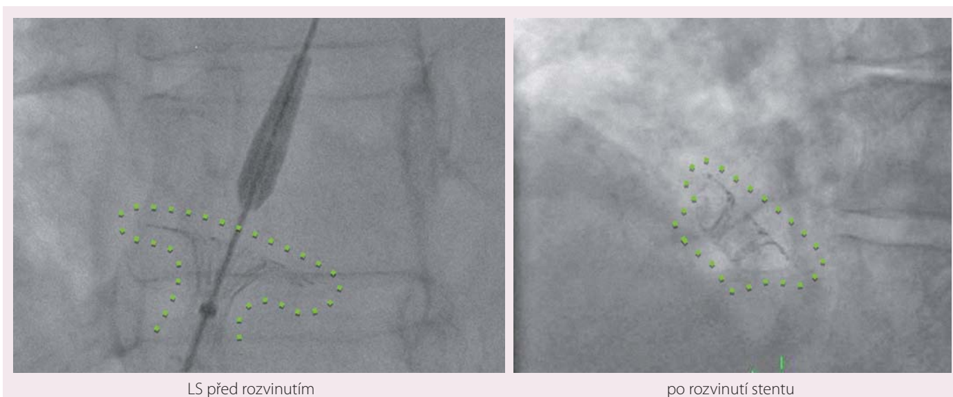
Obr. 2. IASD® v RTG obraze.

Dalším kritériem pro zařazení byl průkaz poruchy diastolické funkce levé komory pomocí echokardiografie pomocí pulzní dopplerovské a tkáňové echokardiografie a průkaz zvětšení levé síně. Pacienti s anamnézou cévní mozkové příhody, hluboké žilní trombózy, plicní