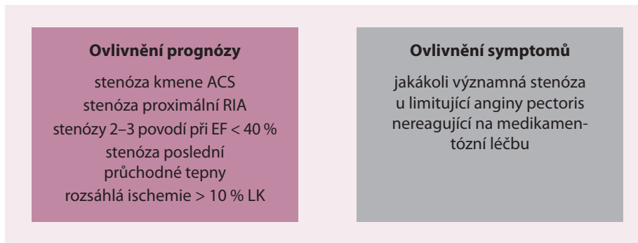
Obr. 2. Indikace k revaskularizaci u námahové anginy pectoris.

prognostické stratifikace je tedy identifikace populace pacientů, u kterých vysoké riziko přetrvává i přes adekvátní medikamentózní léčbu, a u kterých je tedy možné očekávat prognostický benefit z revaskularizace. U těchto pacientů je pak doporučeno provedení koronarografie a dle anatomického nálezu buď perkutánní koronární intervence (PCI), nebo chirurgické revaskularizace myokardu (CABG) (obr. 1).