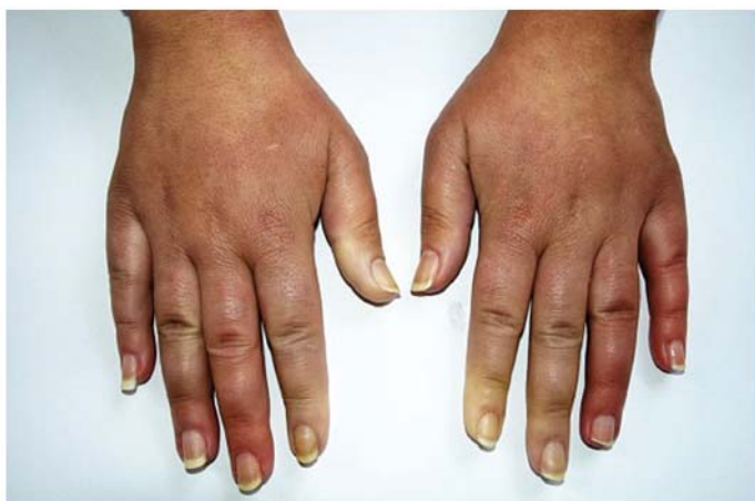
Obr. 1. Raynaudův fenomén, difuzní prosáknutí prstů.