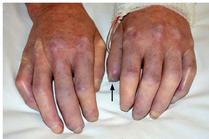
Obr. 2. Sklerodaktylie, jamkovité jizvičky na špičkách prstů (↑).