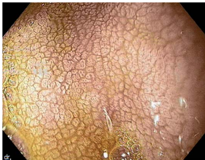
Obr. 2. Atrofická sliznice duodena u pacienta s celiakií.

Až u 50 % dospělých pacientů jsou patrné projevy hyposplenizmu nejasné etiologie, u dětských pacientů je vidán vzácně. Při těžší malabsorpci vitamínu K může docházet k projevům hemoragické diatézy [1].