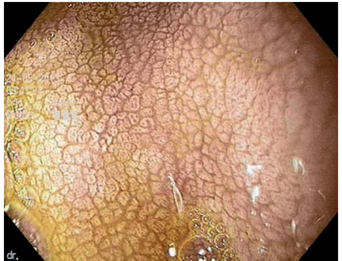
Obr. 2. Atrofická sliznice duodena u pacienta s celiakií.

Až u 50 % dospělých pacientů jsou patrné projevy hyposplenizmu nejasné etiologie, u dětských pacientů je vidán vzácně. Při těžší malabsorpci vitamínu K může docházet k projevům hemoragické diatézy [1].