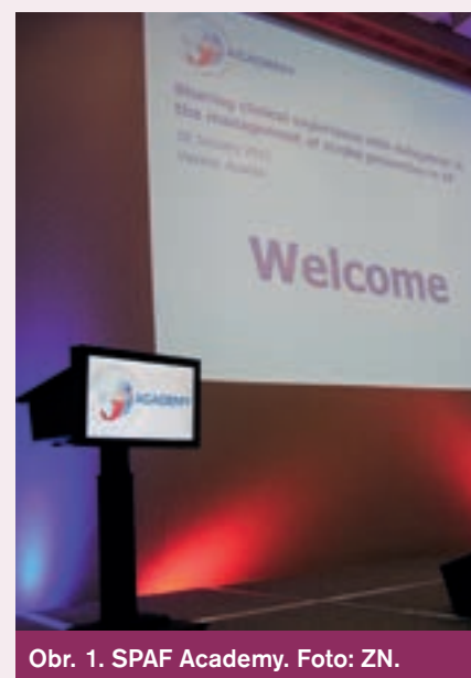
Obr. 1. SPAF Academy.

Analýza závažných krvácení s fatálními následky ve studii RE-LY prokázala významně nižší mortalitu u pacientů léčených dabigatranem oproti pacientům s warfarinem (relativní riziko 0,56 pro dabigatran 150 mg a 110 mg ve srovnání s warfarinem, p = 0,009 ). Navíc u pacientů léčených dabigatranem byla ve studii RE-LY zaznamenána významně kratší průměrná délka pobytu na JIP a koronární JIP oproti nemocným s warfarinem (1,6 vs 2,7 noci, p = 0,01 ).