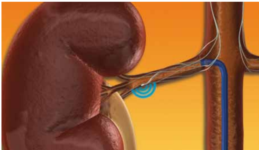
Obr. 1. Místo aplikace radiofrekvenčního proudu v renální tepně (Medtronic, Česká republika).

tak vede ke snížení noradrenalinu v ledvinách, což se projeví snížením tvorby reninu a zvýšením průtoku renální tepnou. Snížením aferentních impulzů vedoucích z ledvin do CNS dochází k poklesu celkového tonu sympatiku.