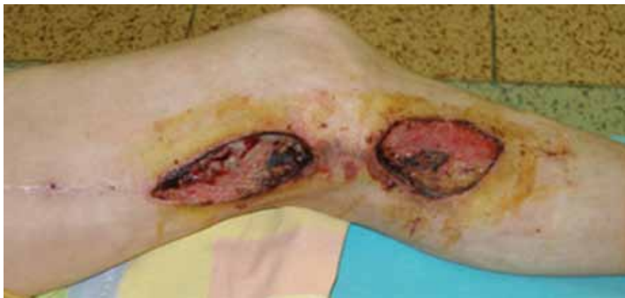
Obr. 1. Infekcia a dehiscencia operačných rán 1 mesiac po implantácii femoro-popliteálneho distálneho bypasu s autológnu reverznou vena saphena magna na ľavej dolnej končatine. Obnažený priechodný bypas v operačnej rane nad kolenom.

uskutočnených u 209 pacientov s vekom nad 70 rokov (tab. 1, 2).