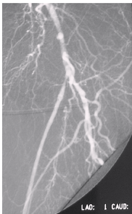
Obr. 4. DSA obraz zlyhávajúceho femoropopliteálneho distálneho bypasu s autológnu reverznou vena saphena magna na ľavej dolnej končatine rok po implantácii. Prítomná stenóza v odstupovej časti bypasu, odstupový uzáver artéria femoralis superficialis.

Sekundárne arteriálne rekonštrukcie po trombotizácii protetických bypasov môžeme rozdeliť do dvoch skupín. Do prvej patria výkony spojené s trombektómiou, revíziou a pokusom o záchranu pôvodnej protézy. Do druhej patria výkony, pri ktorých implantujeme nový bypas so žilou. Na našom pracovisku sa o ďalšom postupe po trombotizácii bypasu rozhodujeme po vykonaní DSA vyšetrenia. Častým problémom u pacientov v našom súbore bola ich polymorbidita s vysokým výskytom pridružených ochorení [7–10]. Chirurgická revaskularizácia je relatívne kontraindikovaná pri nádorových ochoreniach [11–15]. Progresia aterosklerózy je najčastejšou príčinou trombotizácie [16].