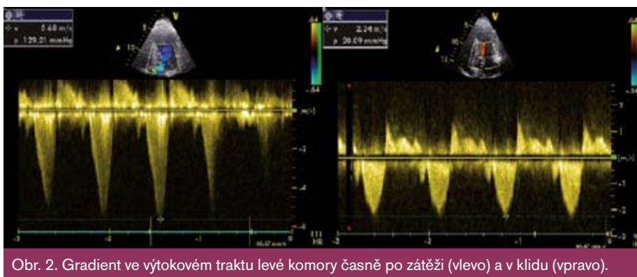
Obr. 2. Gradient ve výtokovém traktu levé komory časně po zátěži (vlevo) a v klidu (vpravo).

k redukci dávky betablokátoru na 25 mg metoprololu 2krát denně, při které došlo k vymizení zrakových symptomů a normalizaci hodnot TK. Kontrolní echokardiografické vyšetření prokázalo normální hodnoty tlakového gradientu v LVOT v klidu a vzestup gradientu po Valsalvově manévru na 36 mmHg. Pacient nadále odmítal provedení alkoholové septální ablace, a tak byl k stávající terapii přidán trimetazidin 35 mg 2krát denně. Při kontrole po dalších dvou měsících je pacient bez bolestí na hrudi, pozoruje pouze dušnost při větší námaze.