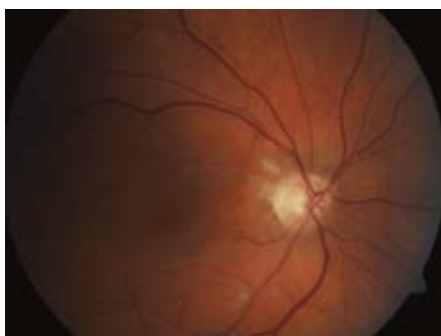
Obr. 4. Oční pozadí – týž pacient. Za jeden měsíc od podání systémové trombolytické terapie, vstřebání vatovitých exsudátů, téměř úplná úprava zrakové ostrosti.

smen Group for Lysis in The Eye Study). Jde zatím o jedinou prospektivní randomizovanou multicentrickou studii. Studie byla pečlivě připravena tak, aby přinesla jednoznačné výsledky a co nejvíce odpovídala reálné praxi. Nepřinesla však zdaleka takové výsledky, jaké odborná veřejnost očekávala. Původně měla probíhat v 16 centrech ve Švýcarsku, Německu a Rakousku, kde jsou s fibrinolytickou léčbou největší zkušenosti. Nábor začal v září roku 2002 a ukončení bylo v plánu v roce 2006. Autoři chtěli do každé z větví randomizovat po 200 pacientech, nicméně v dubnu roku 2005 bylo randomizováno jen 47 nemocných. Okno pro podání trombolytika bylo 20 hod a zraková ostrost před zahájením konzervativní nebo endovaskulární léčby musela být < 0,5 . Používaným fibrinolytikem byla altepláza. Primárním cílem bylo zhodnocení vizu až po jednom měsíci, protože z klinického pozorování je známo, že první efekt trombolytické léčby je sice patrný již po prvních 12 hod, kdy se obnovuje perfuze postiženou tepnou, nicméně ke zlepšování vizu dochází ještě v průběhu prvního měsíce, kdy regreduje edém papily zračkového nervu [12]. Druhotným cílem bylo porovnání bezpečnosti obou metod.