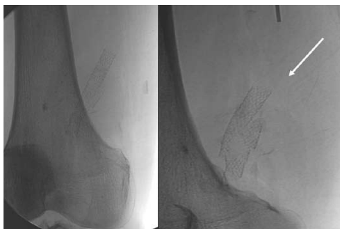
Obr. 4. Fraktura stentu v popliteální oblasti (šipka – nativní obraz).

škození stentu ve femoropopliteálním segmentu dochází kvůli působení velkých dynamických sil (axiální komprese a cyklická flexe) v této oblasti během flexe kolena [8–10]. Fraktura stentu vedla v tomto případě k reokluzi cévní rekonstrukce, která byla opět vyřešena endovaskulárně. Podle zavedené praxe implantace stentu do protetického bypassu není doporučena a rutinně se neprovádí. Pokud je chirurgická léčba proveditelná, je vždy preferovaná. Implantace stentu v této oblasti musí být rezervována pouze pro případy, kdy je chirurgické řešení vysoce rizikové a končetina akutně ohrožena.