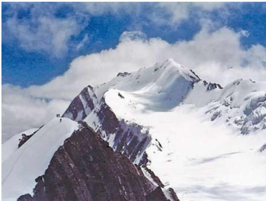
Obr. 3. Tarka 5 368 m.

již při vysokém normálním krevním tlaku a zda je cílovou hodnotou 130 mmHg a méně. Obě tvrzení jsou pouze spekulativní a zatím nemají podklad ve velké klinické studii.