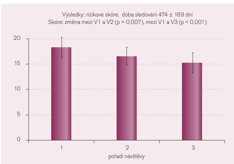
Obr. 2. Vývoj rizikového skóre mezi kontrolami.