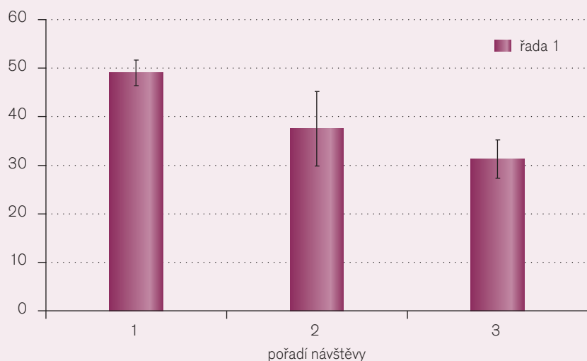
Obr. 1. Vývoj tlaku v plicnici mezi kontrolami.

Výsledky: PAP v mmHg, doba sledování 474 ± 169 dní Odhad systolického tlaku v plicnici (p < 0,001 mezi V1 a V3)