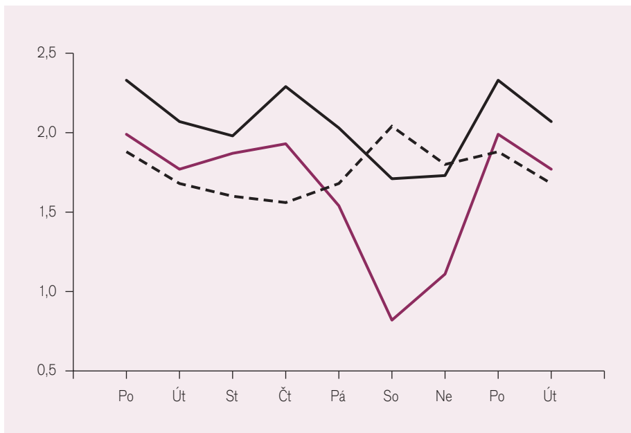
Obr. 1a. Týdenní variace kardiovaskulární nemoci a úmrtnosti (průměrné denní počty připadající na příslušný den v týdnu). Na vodorovné ose dny v týdnu (pondělí a úterý se opakuje pro větší názornost). Černě – PCI provedené v letech 2004–2006 v Brně, černě přerušovaně – náhlá kardiovaskulární úmrtí mimo nemocnici v obvodu Brno II v letech 1975–1983 (násobeno čtyřmi), vínové – ambulantní příjmy s kardiovaskulárním onemocněním za 18 měsíců 1972–1974 v Brně II.