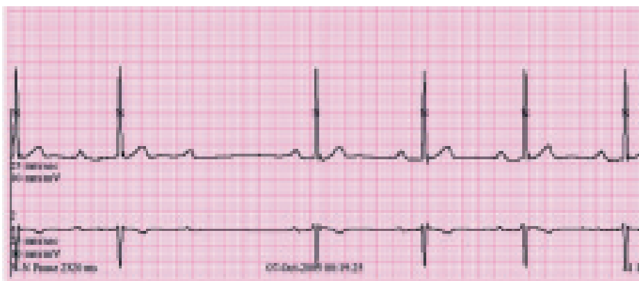
Obr. 2. Záznam AV-blokády II. stupně Wenckebachova typu v nočních hodinách při holterovské monitoraci EKG (48letý sportovec, jehož EKG-křivka je na obr. 1).

sportovní anamnézy, vyloučení organického srdečního onemocnění. Je třeba cíleně pátrat po symptomech, nesmějí se podcenit varovné signály. V případě symptomatických bradyarytmií je nutno zvážit implantaci trvalého kardiostimulátoru, který sám o sobě nepředstavuje kontraindikaci sportovní aktivity, vyžaduje pouze opatrnost při kontaktních sportech. Pro řadu našich sportujících „nemocných“ je zákaz sportovních aktivit zásadním negativním zásahem do kvality života a měl by být vždy racionálně zdůvodněn. V praxi bychom většinu pacientů měli ke sportovní aktivitě spíše povzbuzovat.