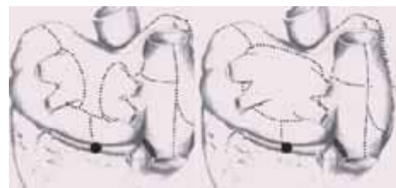
Obr. 1. Cox-MAZE III – tečkovaně jsou vyznačeny průběhy lézí, v levé polovině obrázku modifikace zákroku popsaná v textu.

linie k septu a laterálně rovněž s amputací ouška (obr. 1). Smyslem zákroku je přerušení makro reentry okruhů, lézí kolem plicních žil i izolace triggerů fibrilace síní, čímž je zajištěna účinnost i chronických i paroxysmálních forem fibrilace síní. Elektrické izolace se původně dosahovalo technikou cut and saw (neboli protětím a suturou). Výsledky Coxových prací [3] ukazují až 98 % úspěšnost samotného zákroku, s podporou antiarytmické terapie je úspěšnost až nad 99 %. Po 15letém sledování přetrvává sinusový rytmus u 95 % pacientů. Minimální je incidence embolizačních příhod, a to jak bezprostředně po operaci, tak i dlouhodobě (0,1 % ročně). To lze zdůvodnit jednak uzavěrem ouška, jednak úpravou mechanické funkce levé síně [4]. K selhání procedury dochází při výraznější dilataci levé síně [5], poměrně často rovněž dochází k manifestaci a priori přítomného sick sinus syndromu, který byl maskován běžící fibrilací síní.