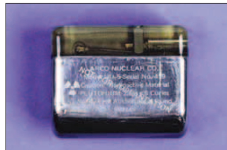
Obr. 6. Nukleární kardiostimulátor vybavený termočlánkem s plutoniem 238 . Tento model Nu-5D vyrobený firmou Arco Nuclear Co. pochází z roku 1976.

Rozvoj 2dutinové stimulace, zahájený už v 60. letech, získal. V USA, kde implantovat mohl jakýkoliv lékař bez nutnosti získání akreditace, byl počet implantujících extrémně velký, a tudíž průměrné počty implantací na 1 lékaře malé, často do 10 pacientů do roka. Implantací zkušenosti byly sporé a znalosti technické stránky věci ještě menší. Ač již byly k dispozici programovatelné kardiostimuláto-