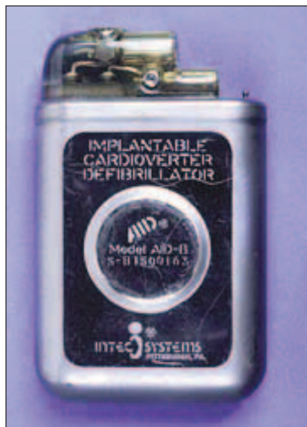
Obr. 7. Jeden z prvních ICD. Tento model AID-B firmy INTEC System pochází z roku 1982. Jednalo se o neprogramovatelný přístroj schopný pouze vysokoenergetického výdeje.

vyvinuté N. Smythem [61,62]. Následně se objevují nové modely elektrody, nejdříve elektrody s členitým povrchem („fractal“) a se zpětnými háčky („tined“) [63] a následně i elektrody s aktivní fixací šroubováním („screw-in“) [64]. Silikonem potažené elektrody jsou nahrazeny polyuretanovými, které jsou pevnější, odolnější vůči mechanické únavě, v průměru menší a na povrchu kluzčí, což umožňovalo snazší zavedení dvou elektrod do jedné žíly [65]. Od roku 1979 je vyvinut systém pro punkční zavedení elektrody (Peel-Away) do podklíčkové žíly [66] jako upravená forma již známého Seldingerova katetrizačního přístupu. Významnou bariérou ve všeobecném přijetí 2dutinové kardiostimulace implantujícími lékaři byly ale malé znalosti charakteristiky a klinického chování 2dutinového systému in vivo [67]. Extrémní flexibilita nové generace kardiostimulátorů je právě závislá na vnějším programování. Neadekvátní programování a komplexita systému s sebou nese potenciální nebezpečí ve formě oversensingu, undersensingu, neadekvátní vlastní inhibice, indukce pacemakerové tachykardie [68] aj. Na lékaře jsou kladeny velké požadavky v porozumění principů a časování [69]. Přes všechny nedokonalosti je jeden z konsenzů NASPE v roce 1984 výrok, že 2dutinová stimulace je indikována v 60–80 % všech případů [70].