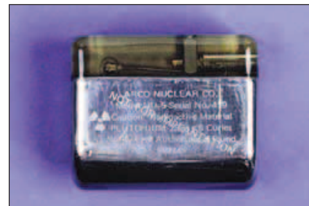
Obr. 6. Nukleární kardiostimulátor vybavený termočlánkem s plutoniem 238. Tento model Nu-5D vyrobený firmou Arco Nuclear Co. pochází z roku 1976.

Rozvoj 2dutinové stimulace, zahájený už v 60. letech, získal. V USA, kde implantovat mohl jakýkoliv lékař bez nutnosti získání akreditace, byl počet implantujících extrémně velký, a tudíž průměrné počty implantací na 1 lékaře malé, často do 10 pacientů do roka. Implantací zkušenosti byly sporé a znalosti technické stránky věci ještě menší. Ač již byly k dispozici programovatelné kardiostimuláto-