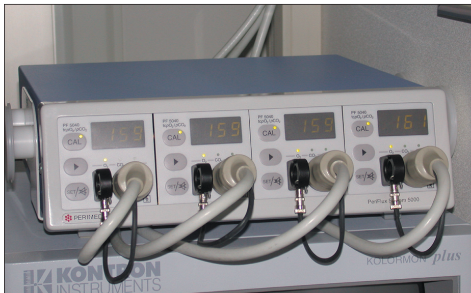
Obr. 1. Systém Periflux 5000.