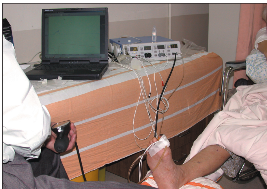
Obr. 2. Systém Periflux 5000 + sonda přiložená na palci PDK.

K systému PERIFLUX 5000 lze připojit velké množství sond, které najdou uplatnění v nejrozličnějších klinických aplikacích [8]: