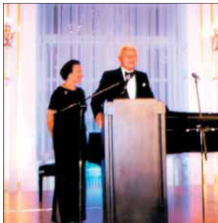
Foto 3. Slavnostní proslov Tomáše Bati juniora – Pražský hrad 17. září 2004.

9. dubna roku 1927 bylo započato s pracemi na výstavbě Baťovy nemocnice (BN) a první pacient byl do ní přijat již 21. listopadu 1927 (dokumentárně doloženo).