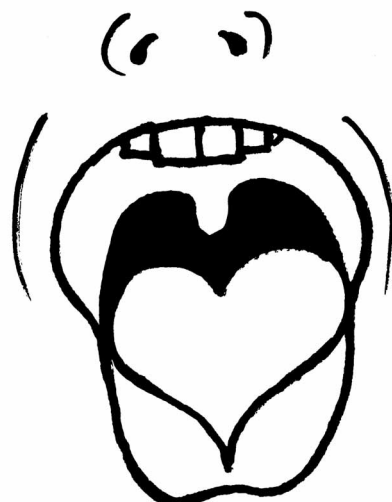
Mít srdce na jazyku – být upřímný, přímý