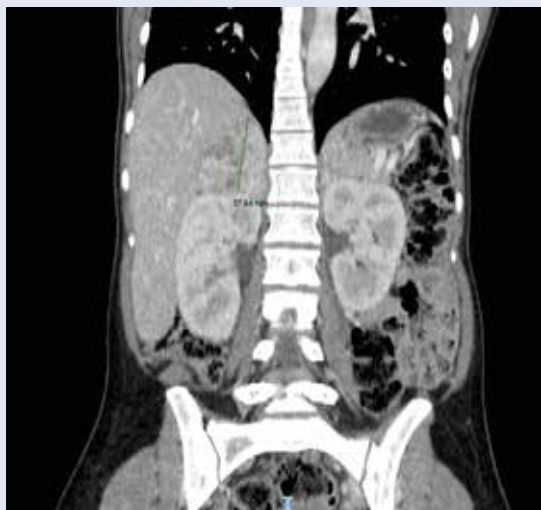
Obr. 1–3 | Lokalizácia feochromocytómov z CT-obrazu

V tejto tehotnosti bol pri príjme TK 160/110 mm Hg a pacientka bola na kontinuálnej liečbe urapidilom i. v.