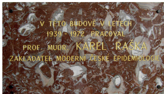
Pamětní deska v budově 2 SZÚ, odhalená v r. 1995 u příležitosti oslav 70. výročí založení SZÚ

V roce 2009 bylo připomenuto 100 let od narození prof. Rašky sympoziem „Surveillance a budoucnost epidemiologie“, které organizovaly 1. LF UK, SEM ČLS JEP ve spolupráci se SZÚ a 3. LF UK v Praze. V roce 2010, kdy svět vzpomínal 30. výročí vymýcení neštovic, uspořádala pražská kancelář WHO odbornou konferenci, výstavu „Smrt neštovic“ a tiskovou konferenci. Ve stejném roce byla na rodném domě prof. Rašky ve Strašíně ve spolupráci SEM ČLS JEP, kanceláře WHO v ČR, Ministerstva zdravotnictví a obce Strašín, odhalena pamětní deska. V letech 2008–2019 udělila SEM ČLS JEP Cenu profesora Karly Rašky svým členům za nejlepší odbornou publikaci v předchozím roce. V roce 2017 byl 6. Kongres klinické mikrobiologie, infekčních nemocí