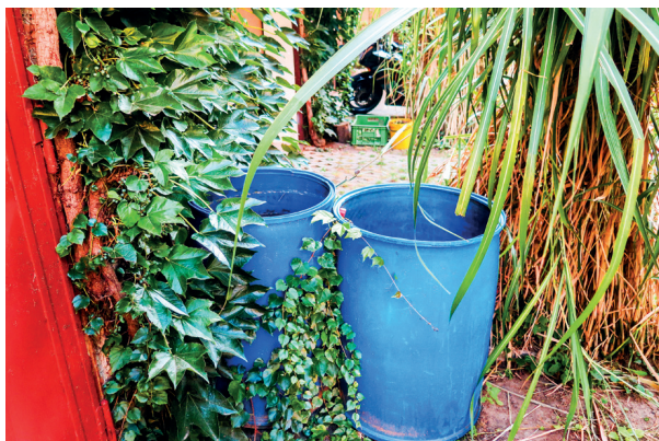
Obr. 3. Okolí nákazy Figure 3. WNV transmission area