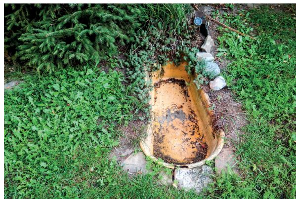
Obr. 4. Okolí nákazy Figure 4. WNV transmission area

podle diagnostických kritérií definovaných v rozhodnutí Evropské komise z června 2018 [18]. Laboratorní výsledky byly potvrzeny v Národní referenční laboratoři pro arboviry ve Zdravotním ústavu v Ostravě. Jedná se o 3 muže (ve věku 51, 52 a 74 let) a 2 ženy (ve věku 72 a 46 let). Čtyři pacienti byli hospitalizováni – 3 případy bez komplikací, 1 případ fatální; 1 případ léčen ambulantně. Délka hospitalizace v časovém rozpětí 11–17 dnů, průměr 14 dnů, medián 14 dnů. K nákaze WNV došlo ve všech případech v oblasti jižní Moravy, v okolí bydliště pacientů, s vhodnými podmínkami pro výskyt komárů (obr. 1).