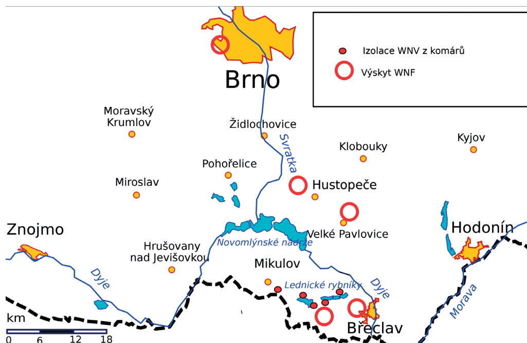
Obr. 1. Lokality akvirace nákazy Figure 1. WNV affected areas

Soubor kazuistik tvoří 5 autochtonních případů, splňujících kritéria potvrzeného případu západonilské horečky