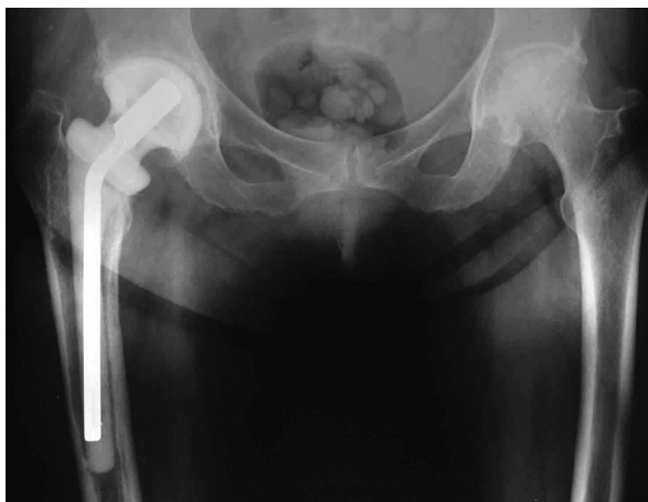
Obr. 1. Rentgenový snímek implantovaného ready-made spaceru kyčelního kloubu Významnou výhodou je zachování délky končetiny. Fig 1. An X-ray of an implanted ready-made total hip spacer, having the advantage of preserving limb length

Ve studii byly použity spacers vyrobené z vysoce porózního kostního polymethylmetakrylátového cementu impregnovaného gentamicinem – Syncicem® (obr. 1 a 2). Kyčelní spacer obsahuje 2,12 g gentamicinu, obsah gentamicinu v kolenním spaceru je 3,38 g. Podle výrobce spacers Syncicem® vykazují bifázický profil uvolňování antibiotika – po iničiálním uvolnění vysokých koncentrací (koncentrační vrchol je mezi 24–48 hodinami) následuje fáze nižšího, postupného uvolňování antibiotika do okolí spaceru. Spacers kyčelního kloubu a kolenního kloubu jsou z mechanického hlediska navrženy tak, aby vydržely in situ minimálně 6 měsíců [9].