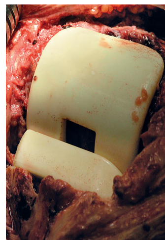
Obr. 2. Peroperační snímek implantovaného kolenního spaceru Sycicem® Fig 2. Perioperative photo of an implanted Sycicem® knee spacer

K reimplantaci nové TEP se přistoupilo ve chvíli, kdy měl pacient opakovaně negativní laboratorní markery zánětu (FW, CRP) a negativní klinický nález (chybění známek zá-