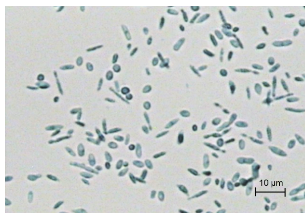
Obr. 2. a, b A. kalrae , artrokonídiá, fuziformné a guľovité konídiá (Sabouraudov agar, vláknitá forma, 25 °C, preparát v laktófenole)