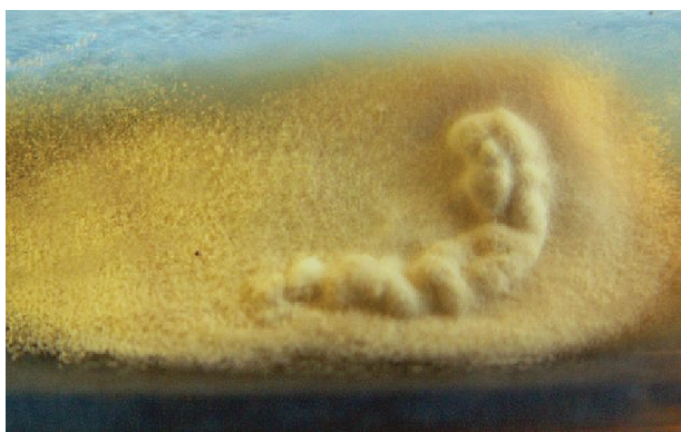
Obr. 1. Arthrographis kalrae , kolónia (Sabouraudov agar, 3 týždne, 25 °C)