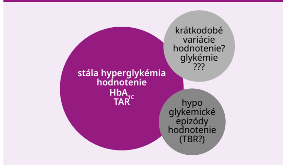
Schéma 2 | Vzájomná prepojenosť jednotlivých súčastí dysglykémie pri diabetes mellitus

TAR – hladina glukózy v krvi nad pásmom dobrej kompenzácie/Time Above Range TBR – hladina glukózy v krvi pod pásmom dobrej kompenzácie (v hypoglykemickom pásme)/Time Below Range