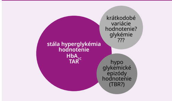
Schéma 2 | Vzájomná prepojenosť jednotlivých súčastí dysglykémie pri diabetes mellitus

TAR – hladina glukózy v krvi nad pásmom dobrej kompenzácie/Time Above Range TBR – hladina glukózy v krvi pod pásmom dobrej kompenzácie (v hypoglykemickej oblasti)/Time Below Range