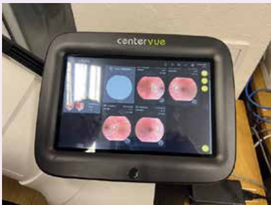
Obr. 1 | Zobrazenie skenov očnému pozadia nemydriatickou fundus kamerou na displeji

Najzávažnejšie, predtým nediagnostikované nálezy sa zistili väčšinou u pacientov v strednom ale aj v mladšom veku, ktorí sa pri vyťaženi nedostavili na očné vyšetrenie napriek tomu, že naňho boli diabetológom odoslaní. To dokazuje, že vykonávať skríníng DR pomocou AI je vhodné práve na diabetologických ambulanciách, na ktorých je najväčšia koncentrácia diabe-